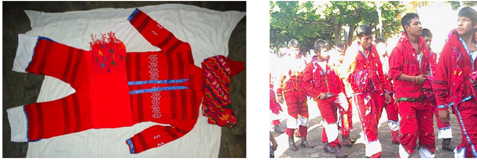
Figura 5. Traje de carrerante.