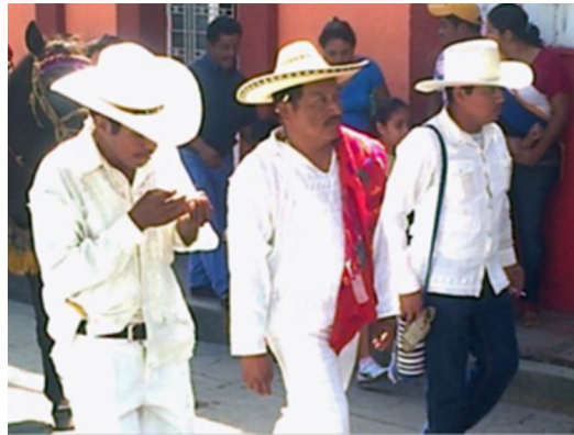
Figura 4. Atuendo de cargo civil