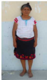
Figura 6. Traje tradicional de mujer adulta

La indumentaria también permite identificar a una persona adulta o de la tercera edad. La principal característica es la menor presencia de dibujos, formas o figuras tanto en el huipil como en la enagua, en el caso de las mujeres, y en el pantalón y la camisa, en el caso de los hombres (figura 6). La variedad de diseños, colores y componentes, evidencia que en la elaboración de la indumentaria existe una expresión colectiva y que se siguen patrones creados por los propios pueblos, demostrando su tradición y costumbre.