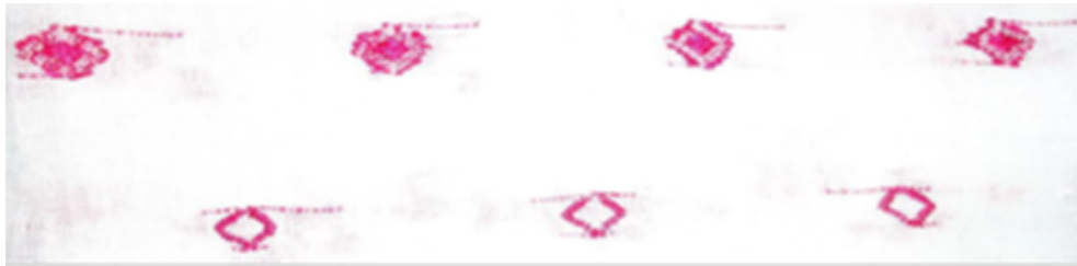
Figura 8. Anillos o rombos (Ch'okobil)