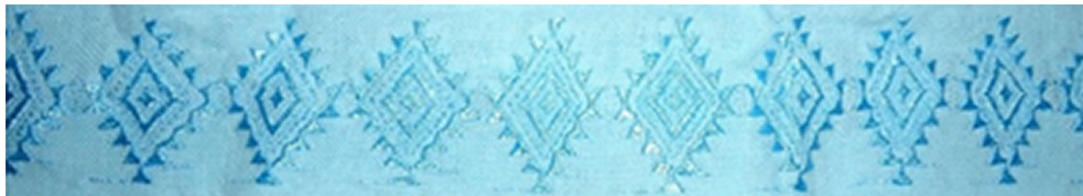
Figura 7. Estrella (Ch'ix k'anal)

Este dibujo representa la estrella grande que sale en el oriente de esta localidad y que guía a los campesinos para la siembra de la milpa.