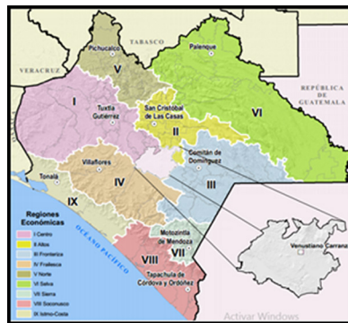
Imagen 1. Ubicación geográfica del Municipio de Venustiano Carranza, Chiapas.

Esta investigación se realizó en el municipio de Venustiano Carranza, Chiapas, se localiza en la Depresión Central, con superficie montañosa y semiplano, las coordenadas geográficas son 16° 21" N y 92° 34" W. Se determina una población de 61,341 habitantes. Colinda al Norte con Totolapa, Nicolás Ruiz y Teopisca, al Noreste con Amatenango del Valle, al Este con Las Rosas y Socoltenango, al Sur con La Concordia, al Oeste con Villa Corzo y Chiapa de Corzo, al Noroeste con Acalá. Tiene una extensión territorial 1,396.1 km 2 .