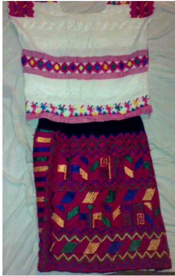
Figura 3. Traje tradicional

en el que entretejen un listón a manera de faja que es tejida y bordada y que tiene un bordado elegante en el centro (López, 2013).