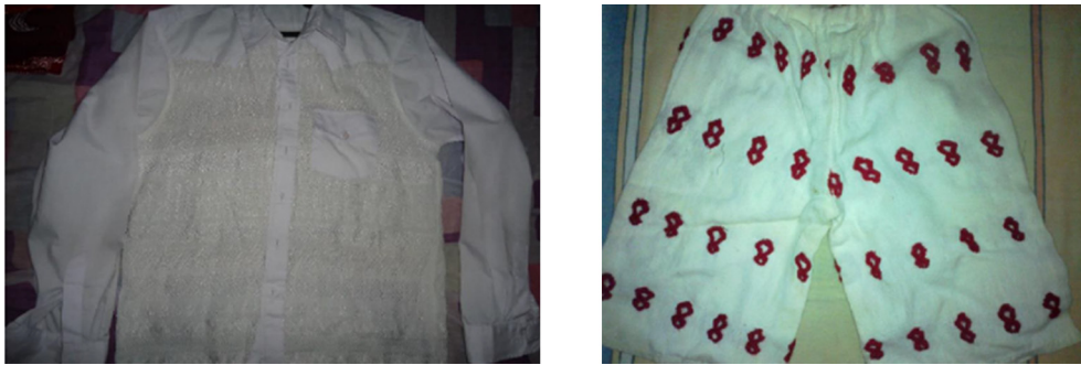
Figura 2. Vestimenta tradicional de hombre.

de arriba hacia abajo. La costura interior de las piernas lleva adornos aislados en hilo blanco o en estambre, lo que hace parecer al pantalón moteado. En los pantalones el estambre es rojo, con ribeteados de morado distribuyéndose en varias hileras transversales, dando en su conjunto un tipo morisco. El diseño de la ropa del varón (figura 2) incluye figuras típicas de la indumentaria usada en el periodo Clásico maya, las cuales pueden observarse esculpidas en estelas antiguas, como la del mural de Bonampak. Diseños semejantes se encuentran también en los dinteles 24 y 26 de Yaxchilán.