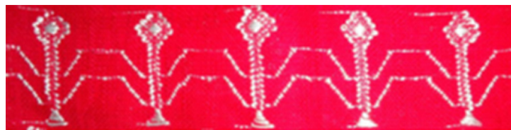
Figura 10. Árbol de ceibo (2)