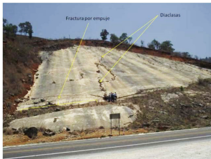
Foto 2. Autopista Tuxtla Gutiérrez-San Cristóbal.

Caso 2. Autopista Tuxtla Gutiérrez-San Cristóbal (190 D) (Foto 2). Ubicación: km 33 ( 16^{\circ}4'41.94'' N, 92^{\circ}46'25.51'' W). Calizas del Cretácico superior.