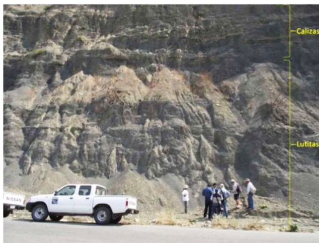
Foto 3. Carretera Chicoasén-Copainalá.

Se ha perdido la cubierta de suelo, y por lo tanto, la cobertura vegetal, acelerando los procesos de erosión.