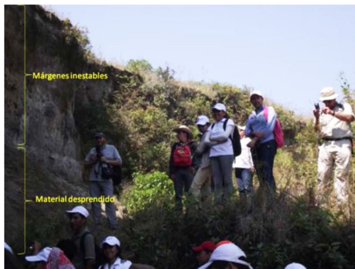
Foto 6. Volcán El Chichón.

Al ser escasa la vegetación arbórea, y ante el intenso sol que se siente a partir de las 9:00 h, los excursionistas generalmente descansan dentro de los cauces donde se proyectan las sombras de sus márgenes que alcanzan hasta 8 m de altura, existiendo la posibilidad de un desplome.