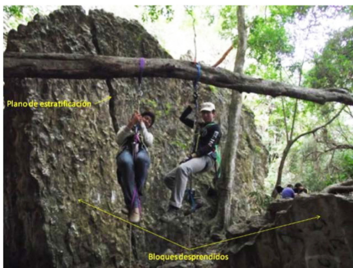
Foto 5. Ladera sur de Tuxtla Gutiérrez.